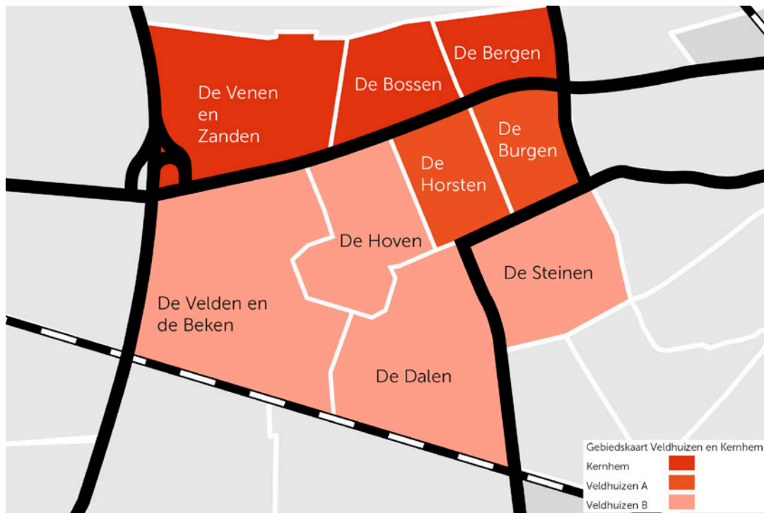
Deze buurten behoren tot het gebied Veldhuizen en Kernhem

In het najaar van 2022 gingen de wijkpartners in gesprek met inwoners en organisaties over hun omgeving. We hoorden wat inwoners belangrijke onderwerpen vinden en waar zij kansen zien om de wijk te verbeteren. En ook waar inwoners zelf mee aan de slag willen. Daarnaast verzamelden we kennis en ervaringen van onder andere de beroepskrachten die dagelijks in de wijk werken. Al deze informatie is gebundeld in een participatieboek. De informatie uit het participatieboek is gecombineerd met informatie uit de Gebiedsprofielen en uit de Leefbaarheidsmonitor . Samen helpen ze om de opgaven in deze gebiedsagenda vorm te geven. Naast een participatieboek hebben we elke gebiedsagenda vormgegeven in een praatplaat. Op de praatplaat staan de tekeningen afgebeeld die horen bij elke opgave.