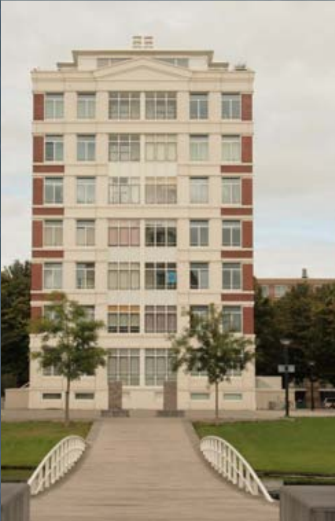
foto ontwerp Bofill