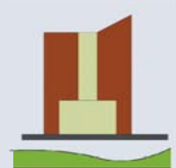
Korrelgrootte & variatie metselwerk