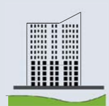
Raamverdeling & verticale geleding