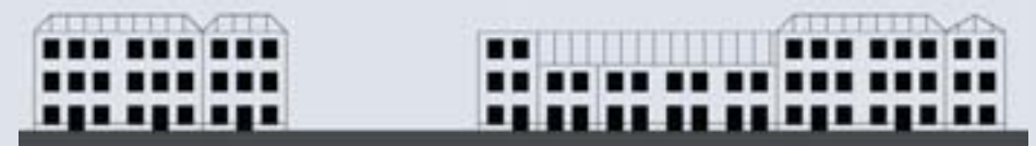
Raamverdeling & verticale geleiding