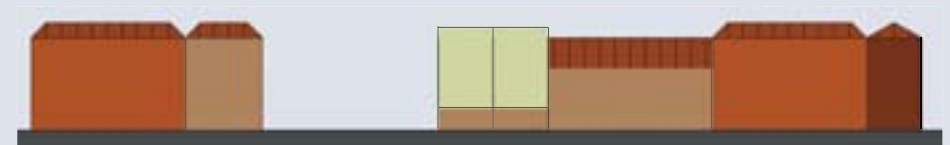
Korrelgrootte & variatie metselwerk