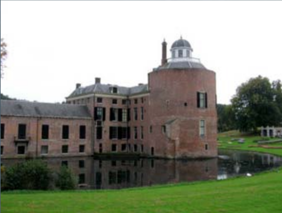
foto kasteel Rosendaal