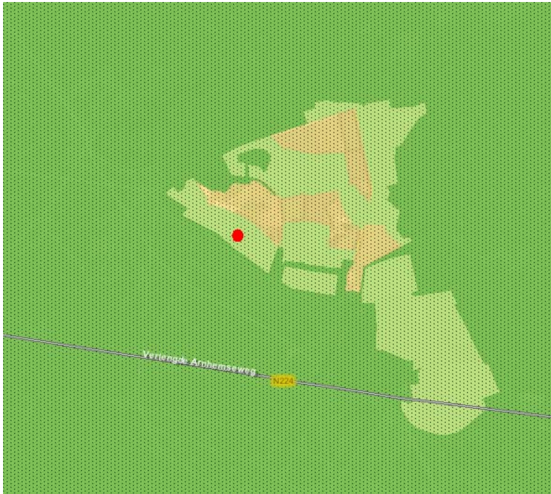
Ligging perceel Streekplan Gelderland 2005

In het streekplan is vastgelegd dat het plangebied gelegen is in de Ecologische Hoofdstructuur (EHS) en nader aangeduid als 'verwevingsgebied'. Voor de Ecologische Hoofdstructuur geldt de 'nee-tenzij' benadering. Dit houdt in dat een bestemmingswijziging niet mogelijk is als daarmee de wezenlijke kenmerken of waarden van het gebied significant worden aangetast, tenzij er geen reële alternatieven zijn. Het plangebied is tevens nader aangeduid als 'verwevingsgebied'. In deze gebieden is natuur nadrukkelijk de belangrijkste functie, maar is er tevens ruimte voor agrarische (en agrarisch gerelateerde) activiteiten. Dit betekent dat er in de verwevingsgebieden meer ruimte is voor bebouwingmogelijkheden voor agrarisch gerelateerde functies, mits dit niet leidt tot aantasting van wezenlijke kenmerken van het plangebied.