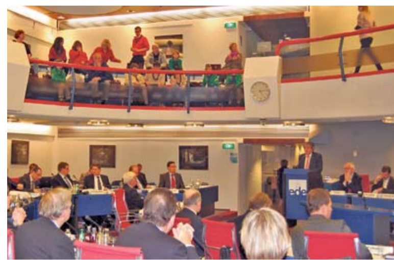
Scouts van scouting Lunteren en scoutinggroep Pieter Maritz kijken toe hoe de raad beslist over het amendement om geld beschikbaar te stellen voor nieuwbouw van door brand verwoeste accommodaties.

graf- en begraafrechten, hondenbelasting, onroerende zaakbelasting, parkeerbelasting (tegen: Fractie Van Os), rioolheffing (tegen: Fractie Van Os) en toeristenbelasting.