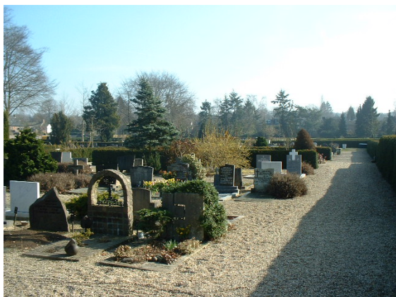
Overzicht van een gedeelte van de begraafplaats gezien vanaf de Alexanderweg.