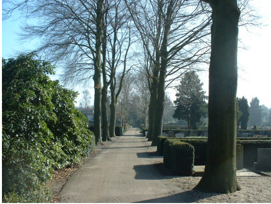
Kenmerkende laanstructuur langs pad.