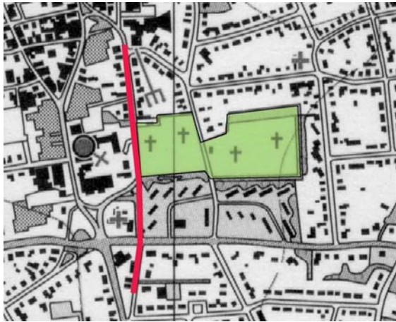
Morfologie en welstandsniveau deelgebied.