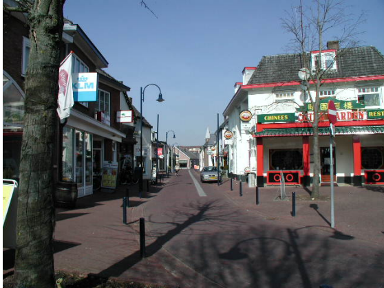
De Brinkstraat met een dichte kleinschalige bebouwing aan weerszijden.