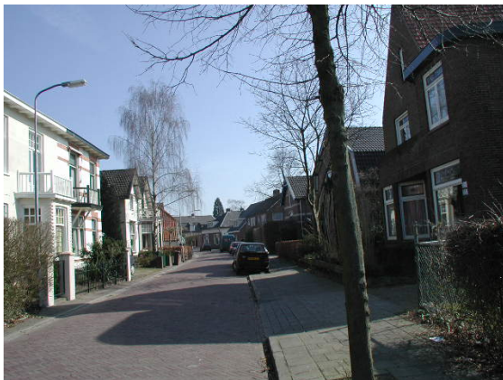
Woonbebouwing langs de Veenderweg.