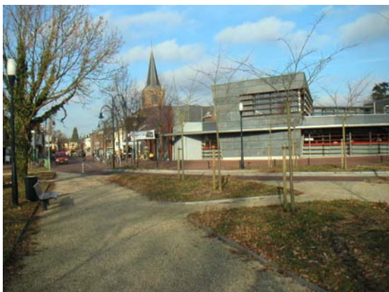
Nieuwbouw op een markant punt aan de zuidelijke entree van het centrumgebied.