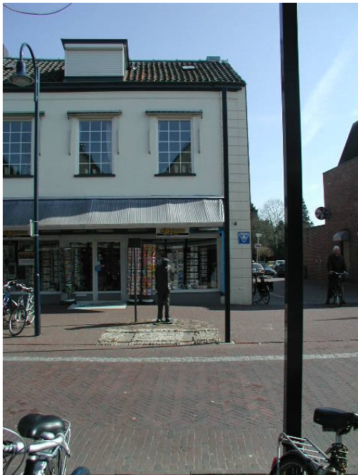
Winkelpui: het onderste gedeelte heeft geen relatie met het bovenste gedeelte.