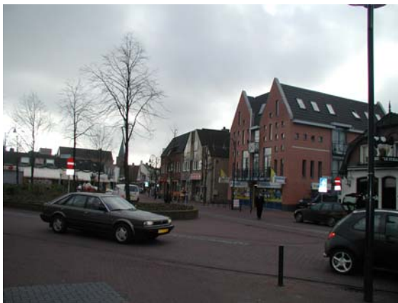
Forse bebouwing aan de westzijde van de Dorpsstraat.