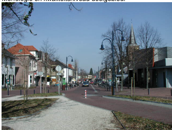
Profiel van de Dorpsstraat gezien vanaf het Bart van Elstplantsoen.