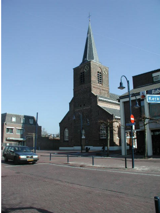
Monumentale panden, zoals de N.H. kerk, staat ingekapseld tussen jongere bebouwing.