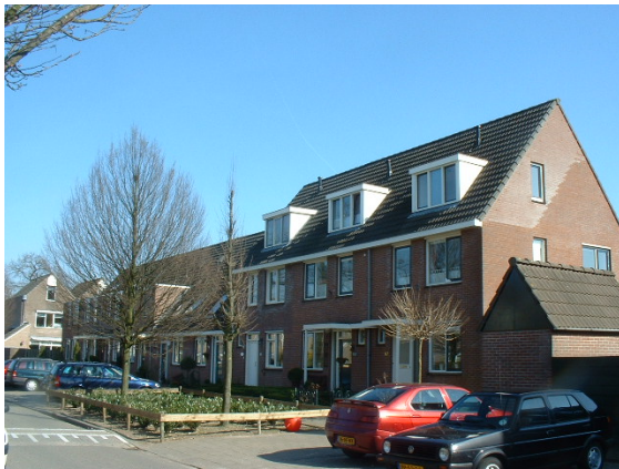
Dakkapellen projectmatig aangebracht, per bouwstrook is er eenheid.