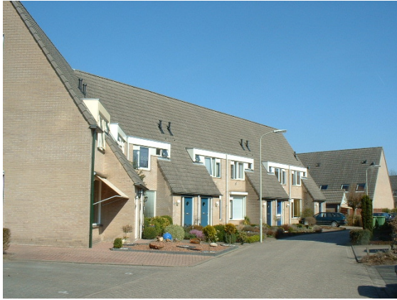
Typend profiel van woningen gebouwd in de jaren tachtig met een knikkende voorgevelrooilijn.