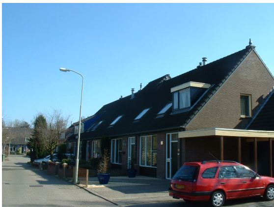
Dakkapel en uitbouw verstoren het straatbeeld niet.