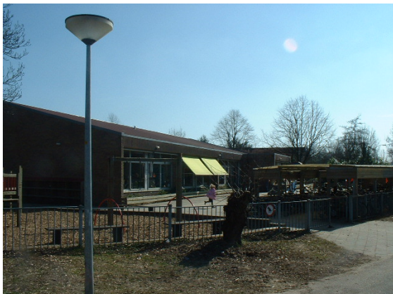
School aan de Boterbloem in dezelfde stijl als bebouwing van het deelgebied.