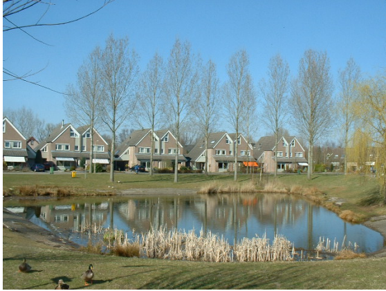
Fraaie openbare groenvoorziening en waterpartij aan de Bevernel.