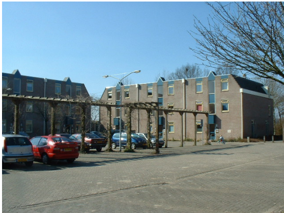
Hogere bebouwingsdichtheden aan de rand van de wijk. Hier aan het Wilgeroosje.

In deelgebied Halderbrink geldt een regulier welstandsbeleid. Welstandstoezicht is gericht op het consolideren van de bestaande kwaliteiten. Aandachtspunt is het aansluiten op bestaande dakvormen en kleurgebruik.