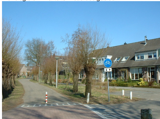
Profiel van de Halderbrinkweg.