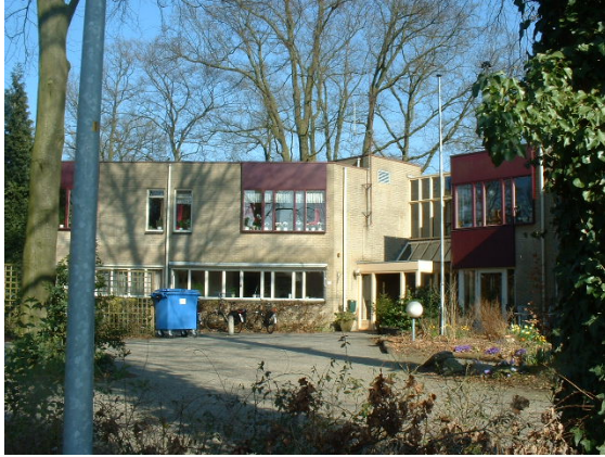
Het wooncomplex voor gehandicapten aan de Johanniterhof.