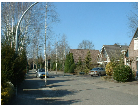
Straatprofiel van de Wuustersgoed: trottoir en wegdek hebben dezelfde bestrating.