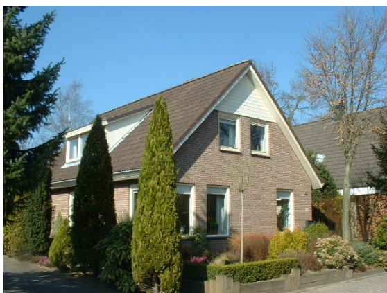
Typerende woning aan de Johanniterlaan