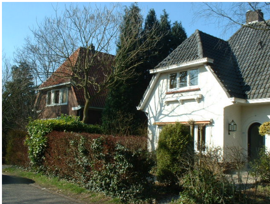
Oudere vrijstaande woningen langs de Eltersehof