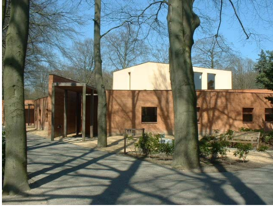
Het bijzondere ontwerp van de aula. Dit is het enige bouwwerk op de begraafplaats.