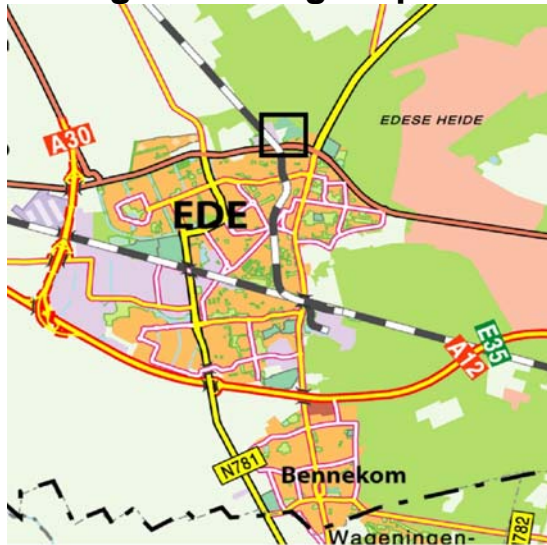
Ligging deelgebied in Ede.