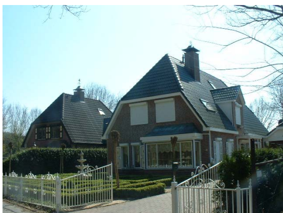
Nieuwbouwwoningen in boerderestijl liggen dicht op de straat.