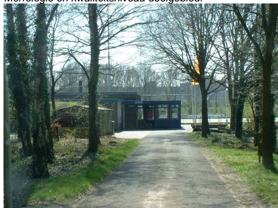
Entree van de Hockeyclub vanaf de Bosrand.