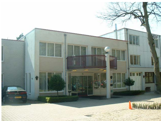
Het congrescentrum behorende bij het hotel 'De Bosrand'.