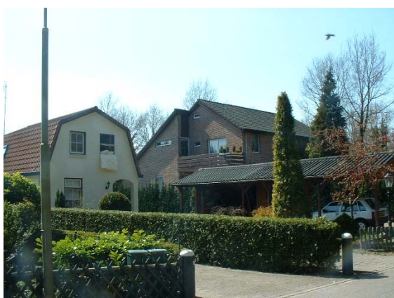
Verschillende woningtypen liggen vrij diep op de kavels.