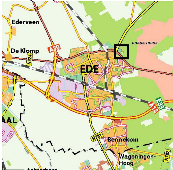
Ligging deelgebied in Ede.