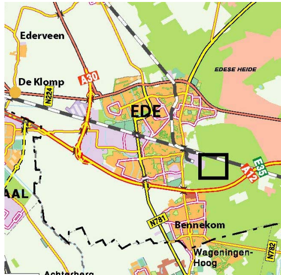
Ligging deelgebied in Ede.