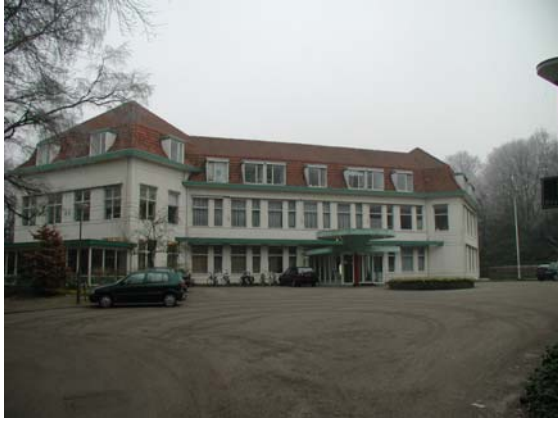
Het hoofdgebouw van de Ederhorst. Door toevoegingen en het schilderwerk ziet het er rommelig uit.