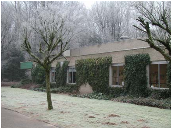
Aanbouw achter de Ederhorst is onopvallend.

grote aandacht te zijn voor de inpassing van bebouwing in het landschap. Hierbij wordt zo veel mogelijk begroeiing gespaard.