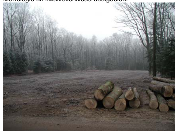
Het terrein van de Ederhorst is dicht begroeid rond een aantal open ruimten.