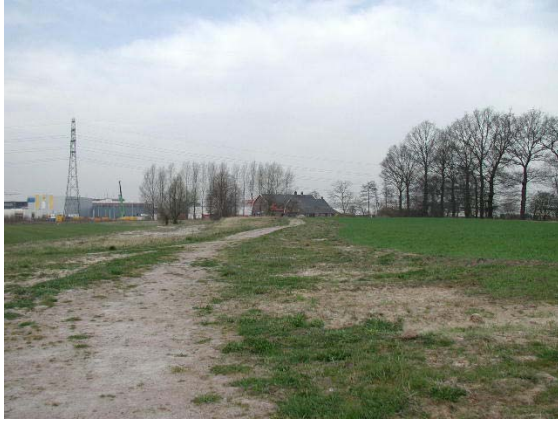
Midden in het industrieterrein ligt een dekzandrug van het Park Rietkampen, inclusief een oude boerderij.