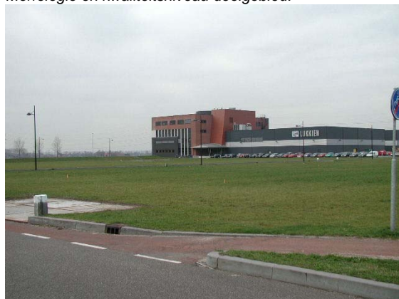
Grootschalige bebouwing Langs de A30