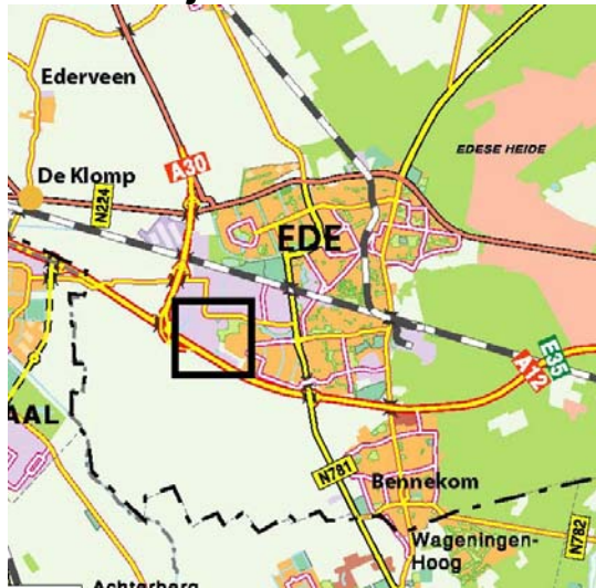
Ligging deelgebied in Ede.