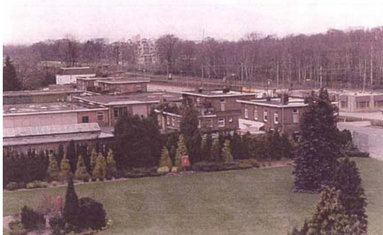
Portierswoningen op het ENKA-terrein.