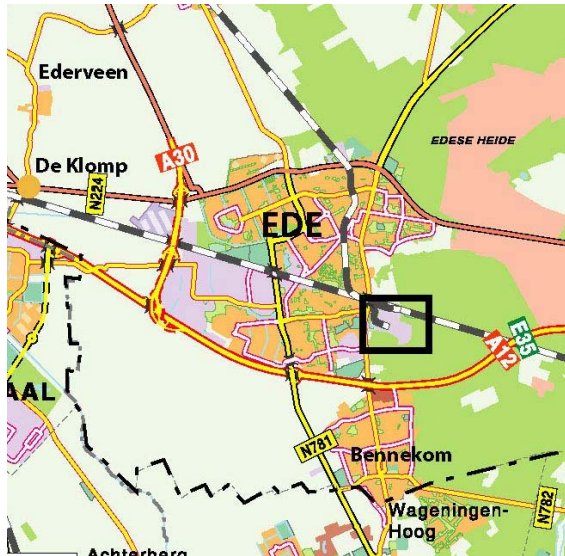
Ligging deelgebied in Ede.