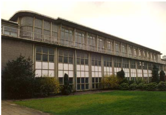
Binnenplaats van het carré.