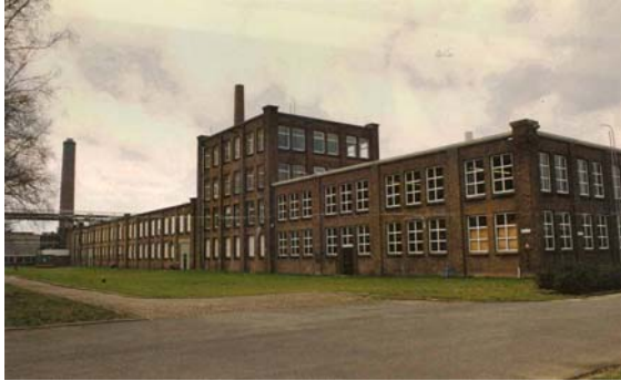
De oostgevel van het carré. Vroeger werd dit gebouw gebruikt voor opslag en als twijnerij.