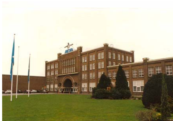
Het poortgebouw aan de noordzijde.