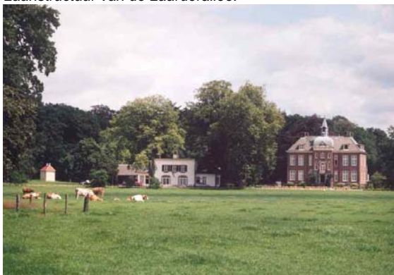
Kasteel en koetshuis gezien vanaf de Hoekelumse Eng.