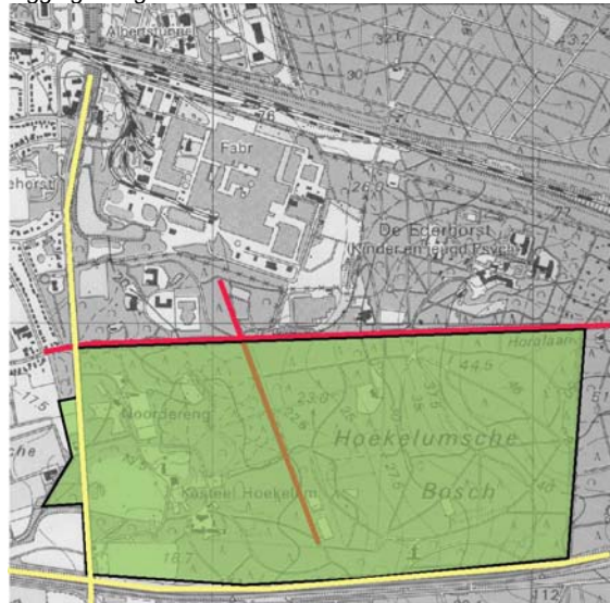
Morfologie en kwaliteitsniveau deelgebied.