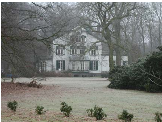
De villa De Noordereng vanaf de Edeseweg.