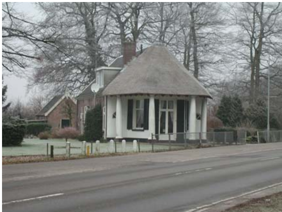
De dienstwoning met op de voorgrond het theehuisje. Gefotografeerd vanaf de Edeseweg.