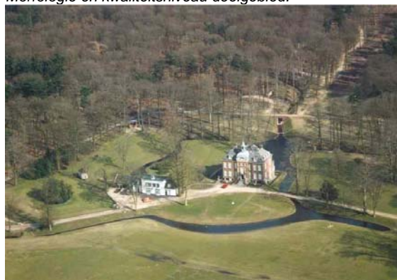
Huize Hoekelum met het koetshuis.