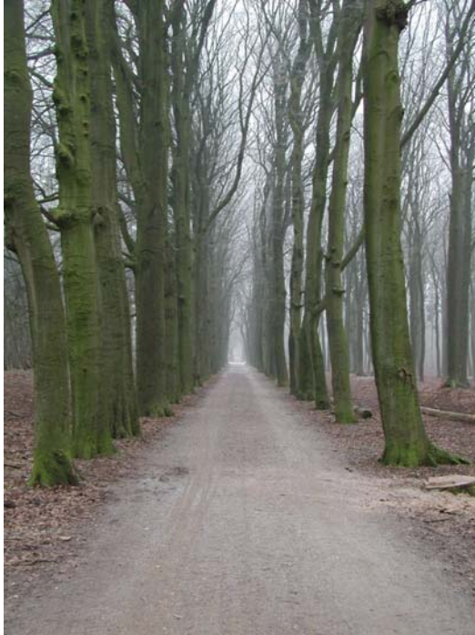
Laanstructuur van de Laarderallee.