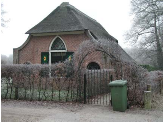
Boerderij behorende bij het landgoed aan de Edeseweg.