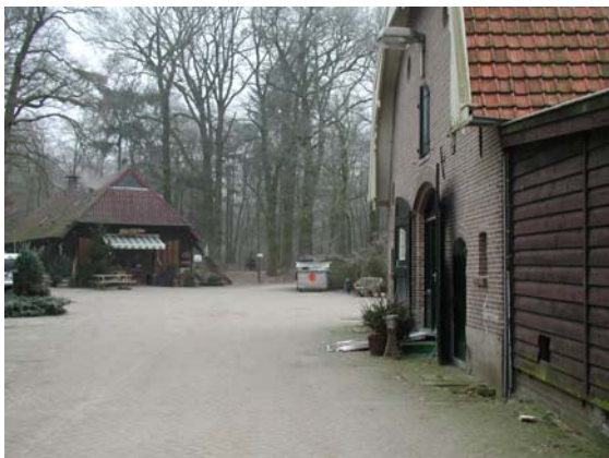
Schuur op het complex van de kaasboerderij.

Het koetshuis en Noordereng hebben een verschillende stijl maar zijn beide opgetrokken uit witte steen. Andere bouwwerken hebben een meer ingetogen boerderijstijl. Ze zijn opgetrokken uit baksteen en hebben houten afwerkingen. Het theehuis aan de dienstwoning is wit gepleisterd en heeft een rieten dak.