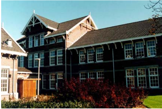
Het tweede hoofdgebouw op de noordzijde van het terrein.

Opvallend is de detaillering van de panden die afhankelijk van de bouwperiode verschilt. De hoofdgebouwen aan de Klinkerbergerweg zijn in een neo-renaïssancistische stijl opgetrokken, de artilleriekazernes in een chaletstijl en de Bergansiuskazerne in een versoberde variant op de Amsterdamse School.