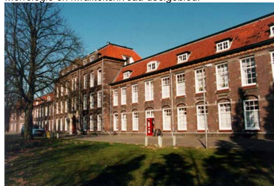
Logiesgebouw van de Mauritskazerne.