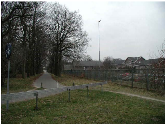
Mauritskazerne met laanstructuur gefotografeerd vanaf de Kazernelaan.