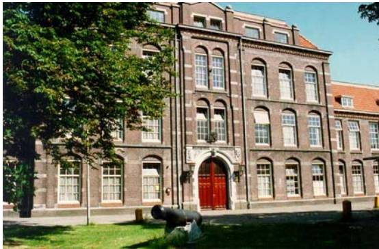
Hoofdgebouw in het zuidelijk deel van het complex.

Voor het deelgebied Kazernecomplex Ede-West geldt een bijzonder welstandsbeleid. Het complex heeft gedeeltelijk de monumentenstatus vanwege zijn bijzondere cultuurhistorische, architectonische en stedenbouwkundige waarden. Het beleid is gericht op handhaving, herstel of versterking van de gewaardeerde ruimtelijke karakteristieken.