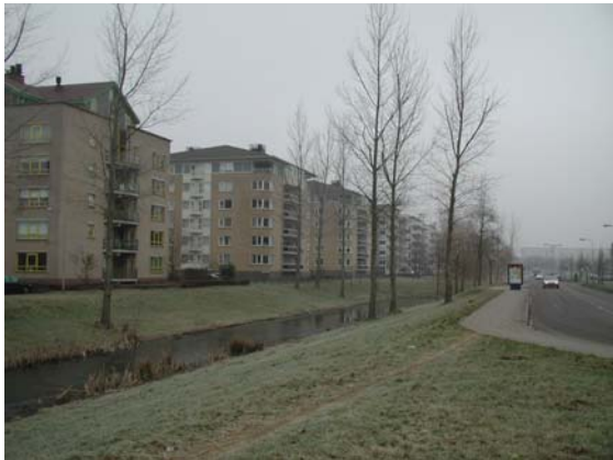
Zogenaamde urban villas, appartementengebouwen aan de Willy Brandtlaan.