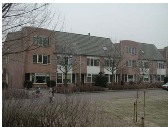
Voor Rietkampen karakteristieke bebouwing aan de Attleedreef.