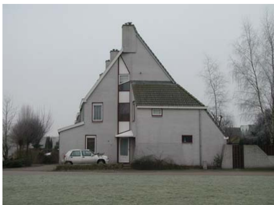
Een organische architectuur aan de Mac Arthurdreef. Een voorbeeld van een expressieve architectuur.