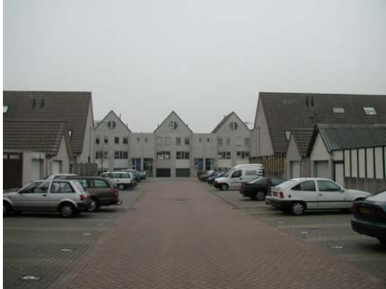
Woonerf aan de Macbridestate.