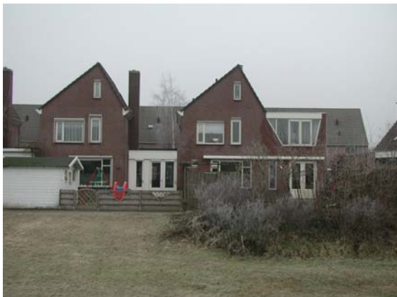
Geschakelde woningen aan de Adamsdreef.

Op beeldbepalende locaties in de wijk zijn appartementengebouwen gelegen die zo'n zes bouwlagen hoog zijn, bijvoorbeeld aan het Prof. Schermerhornpark en langs de noordzijde van de Willy Brandtlaan. Vormen van massa's zijn per cluster op elkaar afgestemd en varieert van eenvoudige, rechte vormen tot meer expressieve vormen. De massaopbouw is per cluster nauwkeurig op elkaar afgestemd.