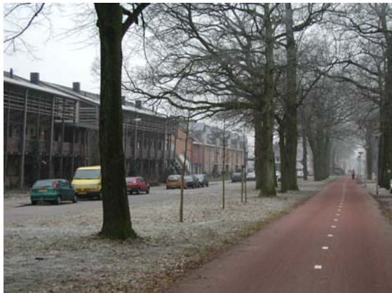
Het Lange Parkpad is een oude route. Hieraan staan nog enkele oudere boerderijen.