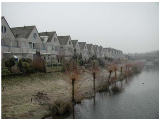
De achterzijde van de M.L. Kingstate grenst aan een singel van het Statepad.