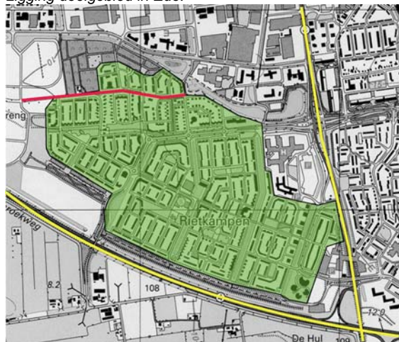
Morfologie en kwaliteitsniveau deelgebied.