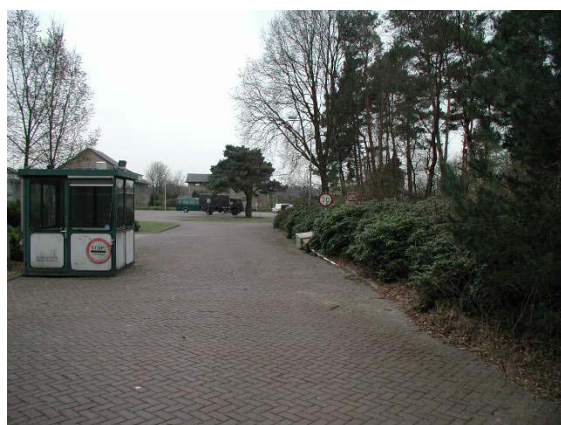
Zicht op het terrein van de Simon Stevin Kazerne. Gefotografeerd vanaf de Nieuwe Kazernelaan.