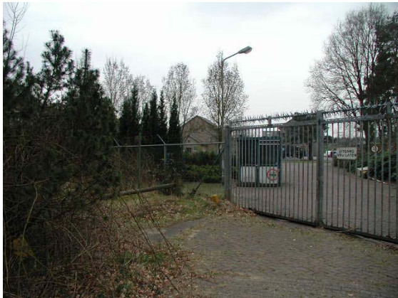
Het terrein is niet openbaar.