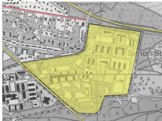
Morfologie en kwaliteitsniveau deelgebied.