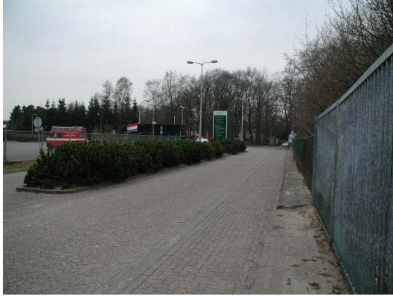
De entree van de Simon Stevin Kazerne.