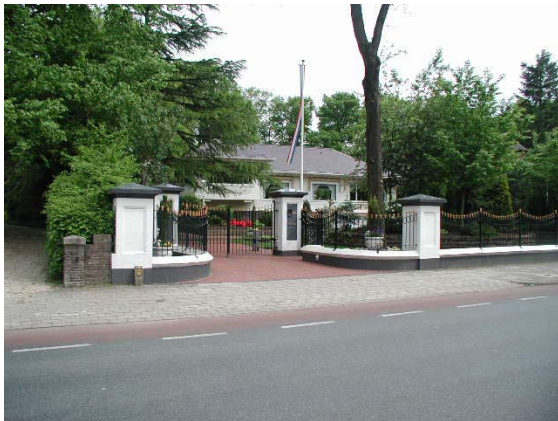
Moderne villa aan de Stationsweg.