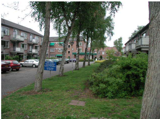
Verzorgingscentrum aan de Laan 1933. In deze buurt zijn relatief veel van dit soort centra.