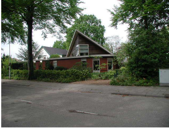
Fraai voorbeeld van moderne invulling aan de Larixlaan.