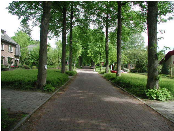
Profiel van de Kazernelaan, op de stuwwal van de Veluwe.