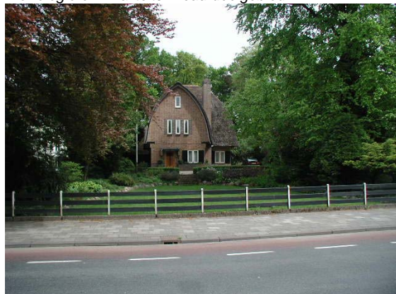
Karakteristieke villa aan de Stationsweg op ruime kavel. De entree is georiënteerd op de straat en de erfafscheiding is in dezelfde stijl als de woning.