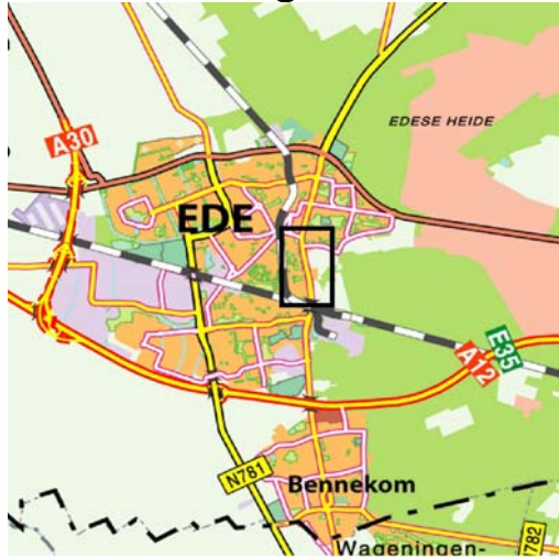
Ligging deelgebied in Ede.