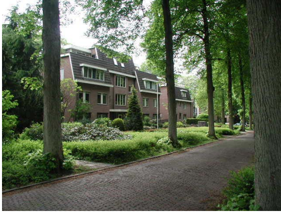
Etagewoningen aan de Kazernelaan.