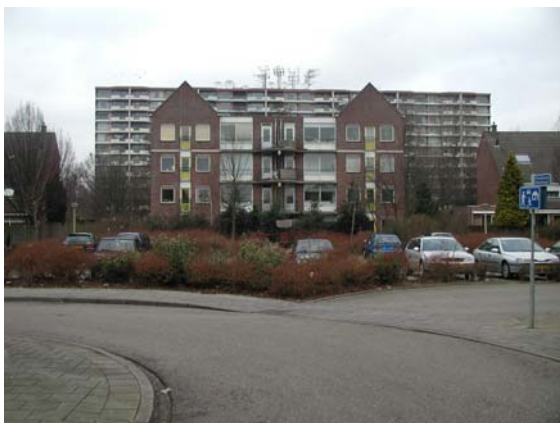
Antennes verstoren het bebouwingsbeeld.