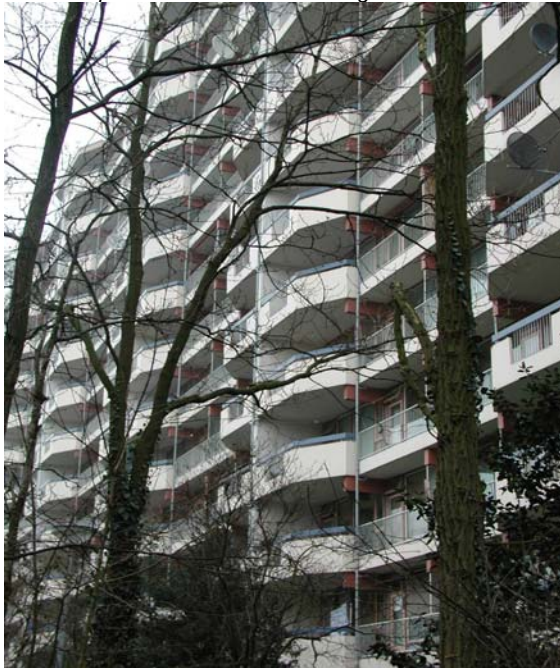
Bijzondere detaillering aan balkon verlevendigt het beeld.