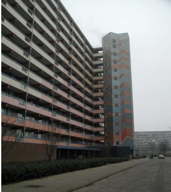
Liftschacht staat los van het hoofdgebouw en is voorzien van een opvallende kleurenschakering.