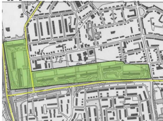
Morfologie en kwaliteitsniveau deelgebied.