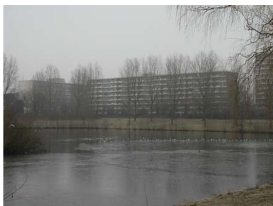
Zicht op hoogbouwflats aan de Keesomstraat vanaf de woonwijk Rietkampen.