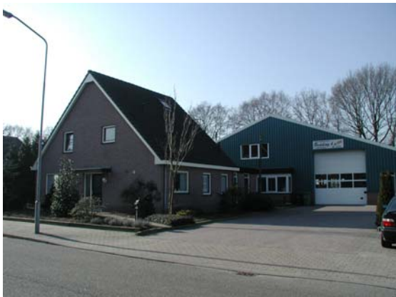
Bedrijfswoning is als afzonderlijke eenheid herkenbaar (voorbeeld De Stroet).