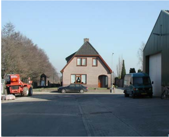
Bedrijfswoningen en bedrijfsgebouwen gaan consequent samen op bedrijventerrein Hooikamp. Dit kenmerkt een 'dorps' bedrijventerrein.