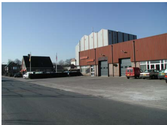
Afwisseling in bouwvormen en -volumes markeren het agrarische karakter van Ederveen. Hier aan de Seringstraat.