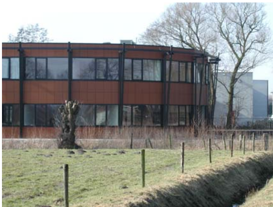
Representatieve gevel is gericht naar de openbare ruimte (voorbeeld De Stroet).