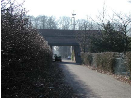
Route onder De Harscamp, vervolgd door een lang lint, de Heersweg.