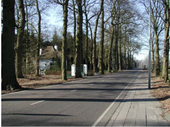
Laanbepanting langs de Edeseweg met tussen de bomen historische bijgebouwen van het landgoed Den Ham.