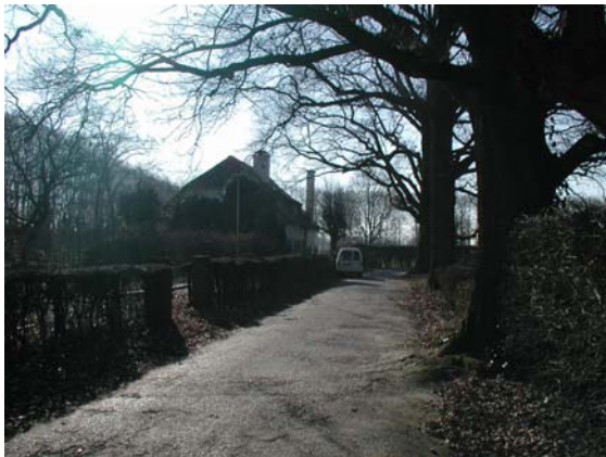
Typisch oude bebouwing omgeven door laanstructuren, hagen en oude bomen.