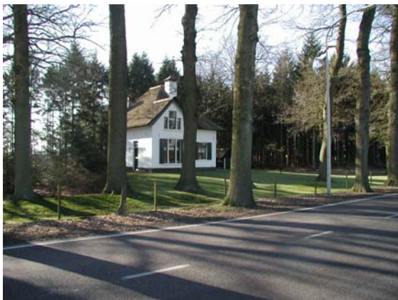
Een voorbeeld van karakteristieke bebouwing langs de Edeseweg. De witte gevel en rieten dak staan prominent tussen het groen.