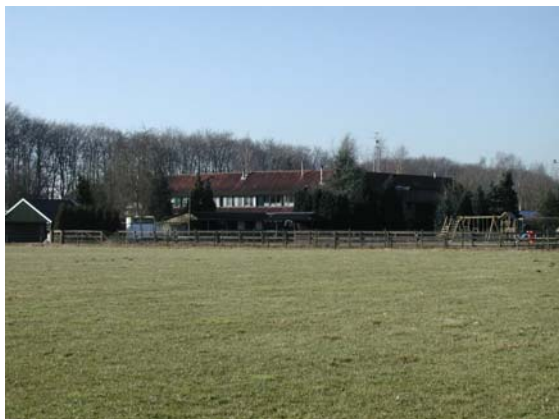
Zicht op de oude proefboerderij De Harscamp, een ontwerp van Berlage.