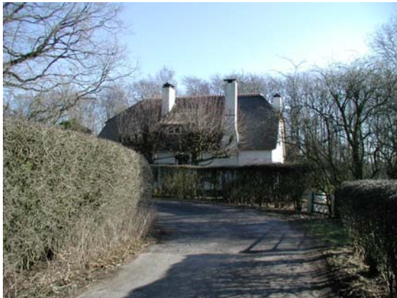
Sfeerbeeld van karakteristieke bebouwing in het deelgebied.