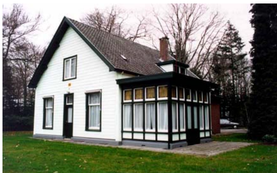
Onderkomen van officiers, gezien vanaf de Otterloseweg. Opvallend is het gebruik van hout..