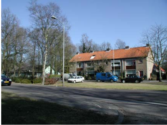
Voormalige officierswoningen net buiten de hekken van de legerplaats aan de Otterloseweg.