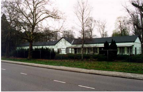
De voormalige officierskantine, gezien vanaf de Otterloseweg. Nu is het in gebruik als museum.