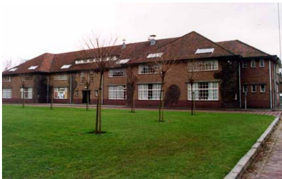
Het stafgebouw verder op het terrein.

Aangezien het gehele deelgebied is aangewezen als bijzonder militair landschap is, geldt voor het deelgebied een bijzonder welstandsniveau. Ook voor de woonbebouwing aan de Otterloseweg geldt een bijzonder welstandsbeleid vanwege de ligging aan een cultuurhistorisch belangrijke route. Het welstandstoezicht is gericht op handhaving en herstel van de huidige kwaliteit.