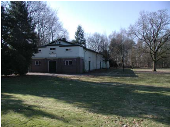
De oude bioscoop, aan de andere kant van de Otterloseweg. Staat op de monumentenlijst. Bijna geheel opgetrokken uit hout.

Het deelgebied legerplaats Harskamp is onderdeel van een bijzonder militair landschap. De oude, vooroorlogse bebouwing is bijzonder goed geconserveerd. Onderdelen zijn in procedure als Rijksmonument, zoals de voormalige bioscoop.