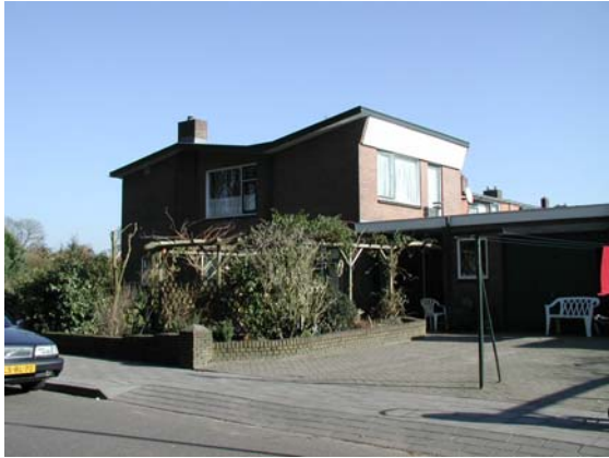
Bijzondere toevoeging aan achterzijde van de woning in zelfde bouwstijl als het hoofdgebouw.