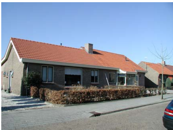
Recentere bouw in dezelfde stijl als belendende woning. Bedekking erker onderbreekt compositie van de overstekken.