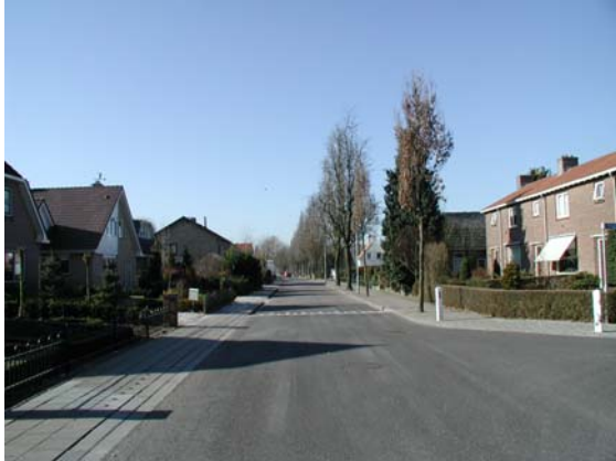
Gevarieerdere bouw langs de Laarweg met rijtjeswoningen en vrijstaande woningen uit verschillende bouwperiodes.