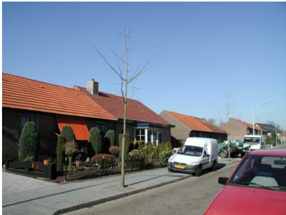
Invulling van recenter datum in passende stijl.