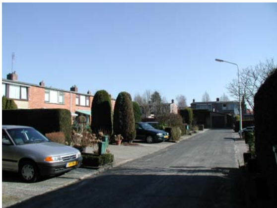
Besloten woonefje langs de Molenweg met uniforme woningbouw. Veel privé-ruimte wordt gebruikt als tuin en/of parkeergelegenheid.

De Prinsessenbuurt is een kleine, rustige woonbuurt aan de rand van Harskamp. Het gebied heeft een heldere stedenbouwkundige opzet. Een deel van de panden is verbouwd of gerenoveerd. De relatie met het aangrenzende open buitengebied zal moeten blijven behouden.