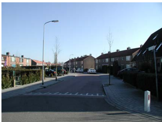
Profiel van de Irenelaan met aaneengesloten bouwstroken.