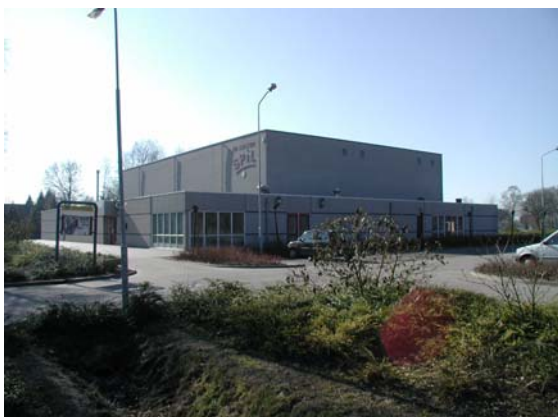
Nieuw dorps huis en sporthal gebouwd aan de Molenweg. Hierachter begint buitengebied van Harskamp.

In de Prinsessenbuurt geldt een regulier welstandsniveau. Welstandstoezicht is hier gericht op consolideren en verbeteren van bestaande kwaliteiten.