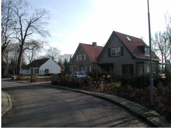
Ruime opzet van het deelgebied met oude boombeplantingen.

Waardebepaling en ontwikkelingen Het Hugo de Vriespark heeft een specifiek eigen karakter door de prominente aanwezigheid van oude boombeplanting en de ruime opzet van de uitleg. Behoud van het groen en van de aanwezige ruimtelijke structuur met ruime opzet zullen de aandachtspunten zijn voor het beleid ten aanzien van het gebied.