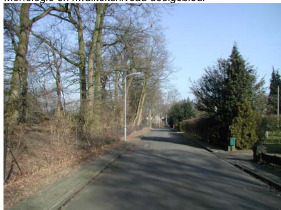
Het profiel van Hugo de Vriespark.