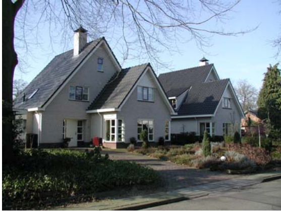
Nieuwbouw in overeenkomstige stijl met overige bebouwing.