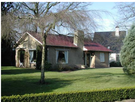
Veel ruimte om de woning.