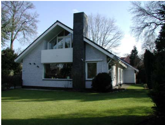
Bebouwing met oog voor detaillering en gevelindeling.