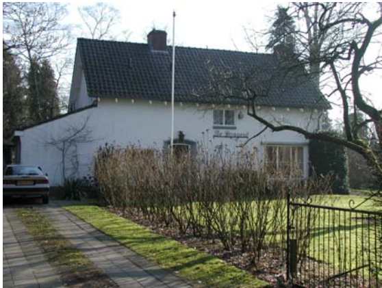
Voorbeeld van een woning met oog voor detaillering.

Voor het woonpark geldt een regulier welstandsniveau. Dit houdt in dat de beoordeling gericht zal zijn op het handhaven van de basiskwaliteit van het gebied.