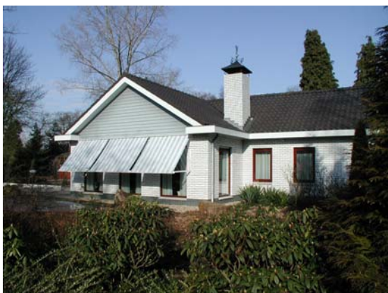
Vrijstaande bebouwing met een individuele uitstraling in een groene omgeving.