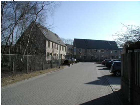
Voorbeeld van geheel gesloten bouwstrook aan de Brummelweg werkt als begeleiding van de straat.