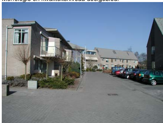
Profiel van de slingerende Brummelweg met bebouwing in hogere dichtheden.