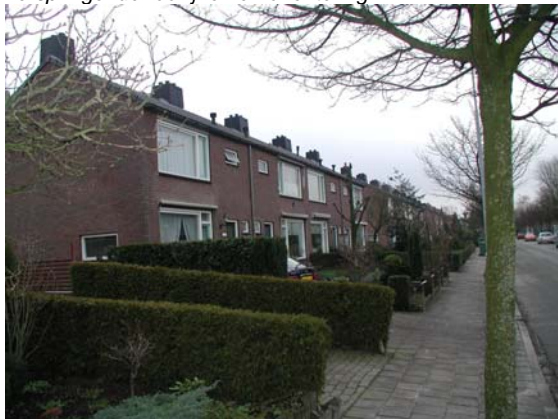
Samenhang in de massa-opbouw.