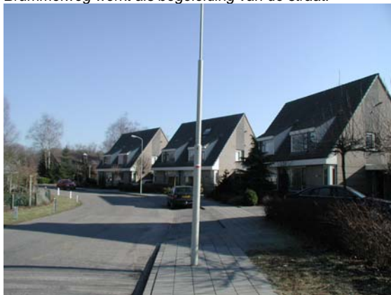
Voorbeelden van identieke geschakelde twee onder een kap woningen aan de Brummelweg.