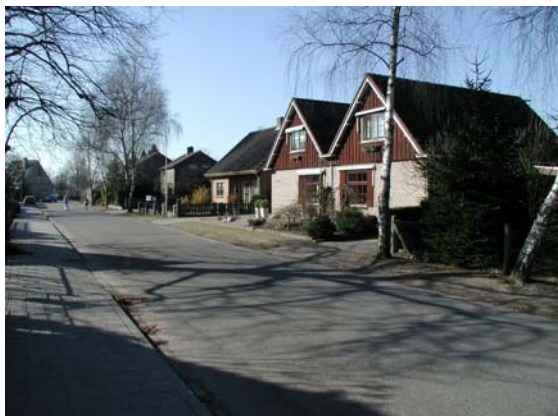
Een divers bebouwingsbeeld aan de Koeweg door verspringende rooilijnen en oriëntering