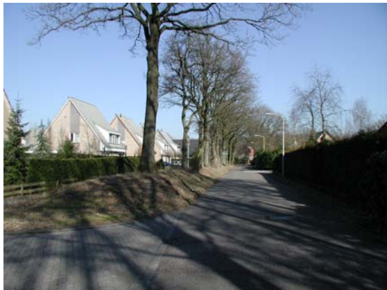
Straatbeeld van de Egypte. Aan deze laanbeplanting is geen bebouwing georiënteerd. Deze wal met bomenrij geven het deelgebied een besloten karakter.