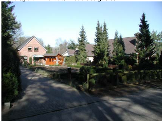
Woningen op ruime kavels. Kavels en omgeving worden getypeerd door veel groen. Hier aan de Buurtboslaan.