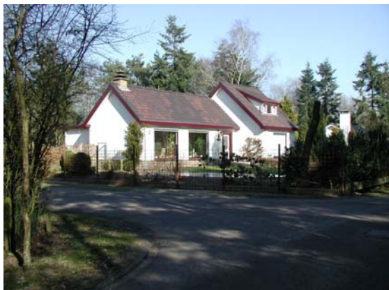
Nieuwbouw aan de Buurtweg. Er wordt gebruik gemaakt van afwijkende kleuren. Architectuur komt echter overeen met overige bebouwing.