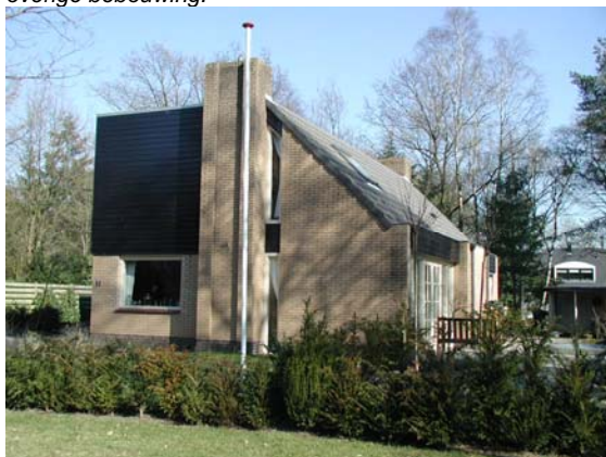
Deze bouw van recenter datum in de Buurtboslaan refereert aan de bebouwing aan de Slingerlaan.