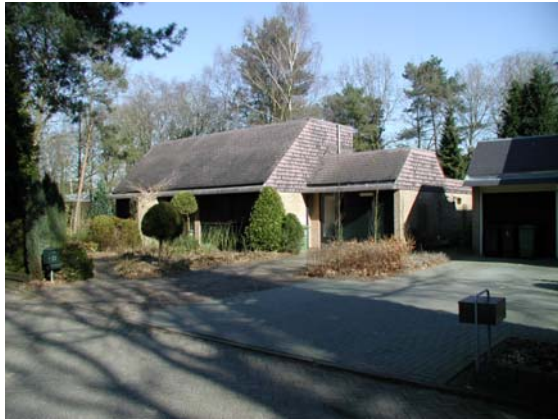
Hoekige bebouwing met rechte lijnen in clusters gesitueerd in een groene omgeving. Deze woningen staan langs de Slingerlaan.