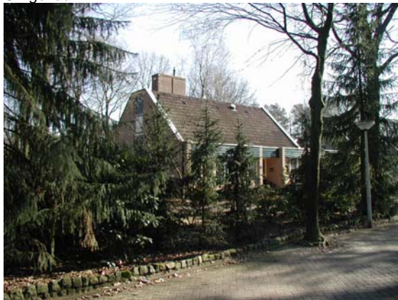
Recentere bebouwing langs de Slingerlaan in overeenkomstige stijl als de oorspronkelijke bebouwing.