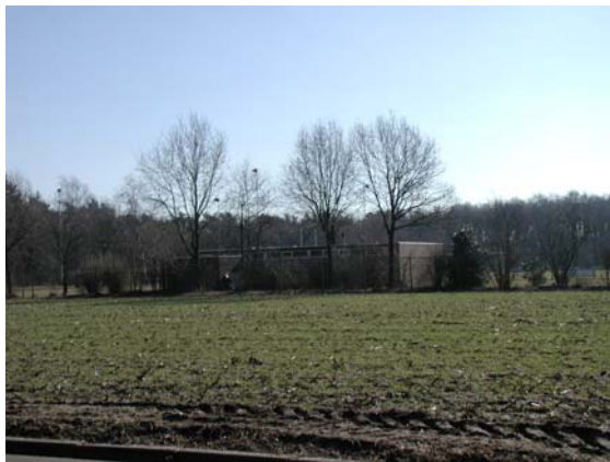
Zicht op Sportpark De Dries vanaf de Houtkampweg.