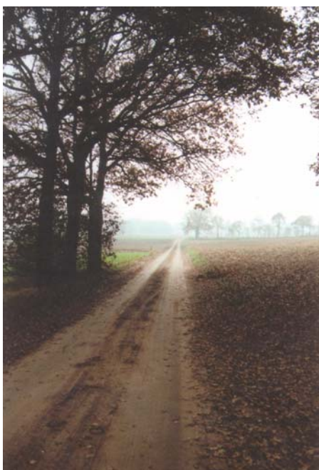
Uitzicht op de Roekelse Eng

De engen (of essen) vormen een overblijfsel van een landschap waar een systeem van eslandbouw functioneerde. Binnen dit systeem bestond een nauwe relatie tussen de es, de bewoning, de groengronden en de heide, en in zekere zin ook de zandverstuivingen. In de gemeente Ede komen zogenaamde flank-esdorpen voor. De bebouwing is hier te vinden aan die zijde van de es waar ook de (lager liggende) groengronden te vinden zijn; aan de hoge zijde van de es ligt het drogere (heide)gebied. Zo loopt de bebouwing parallel aan de stuwwalflank van de Veluwe.