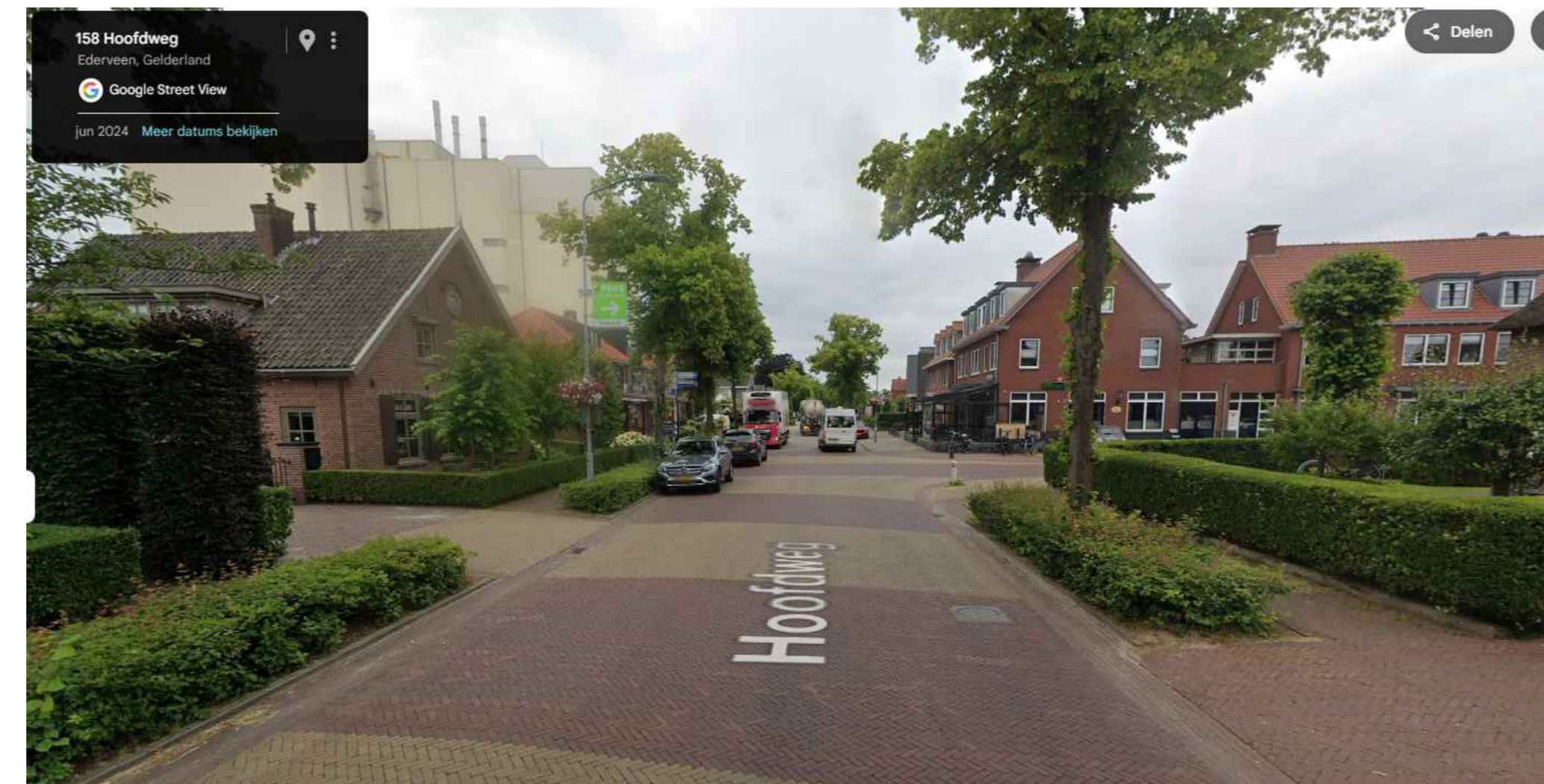
Bestaande situatie, locatie maatregel Hoofdweg noord