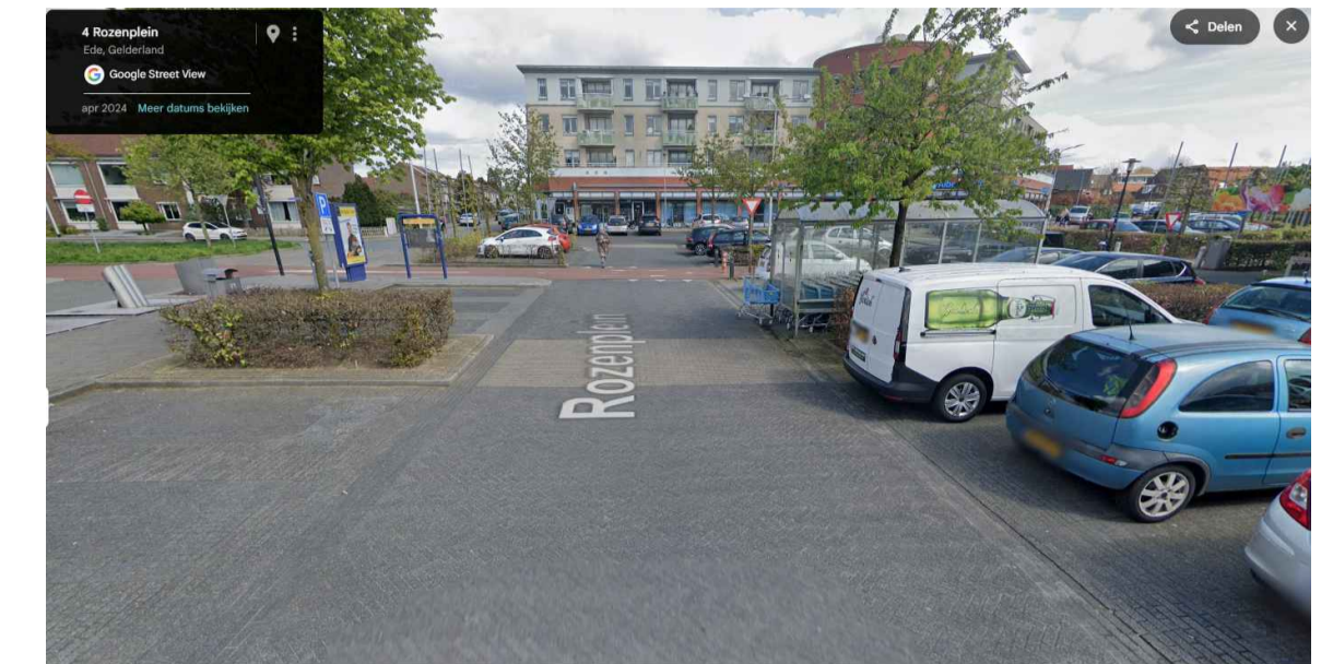
Bestaande situatie, locatie maatregel Rozenplein