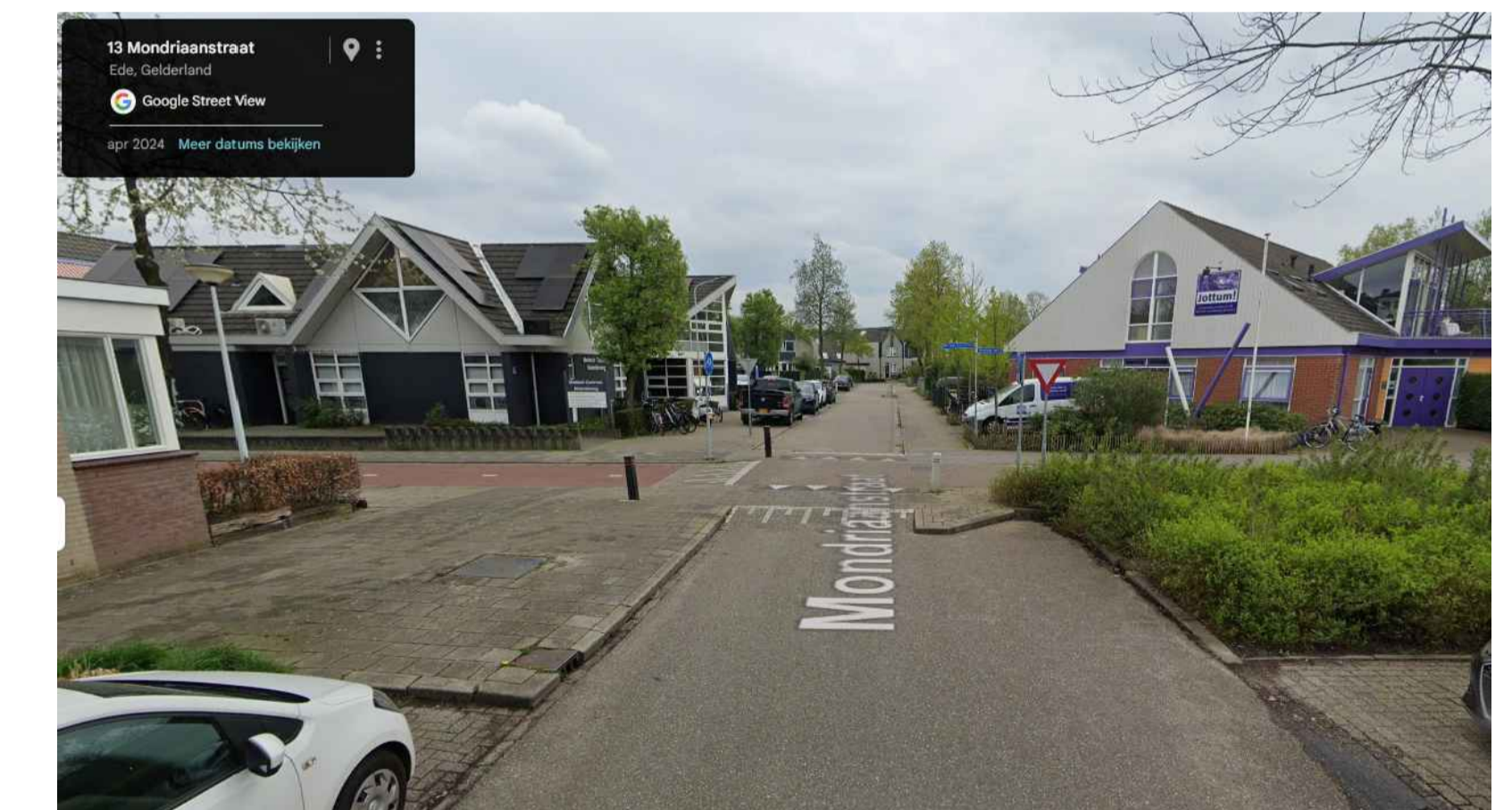
Bestaande situatie, locatie maatregel Mondriaanstraat