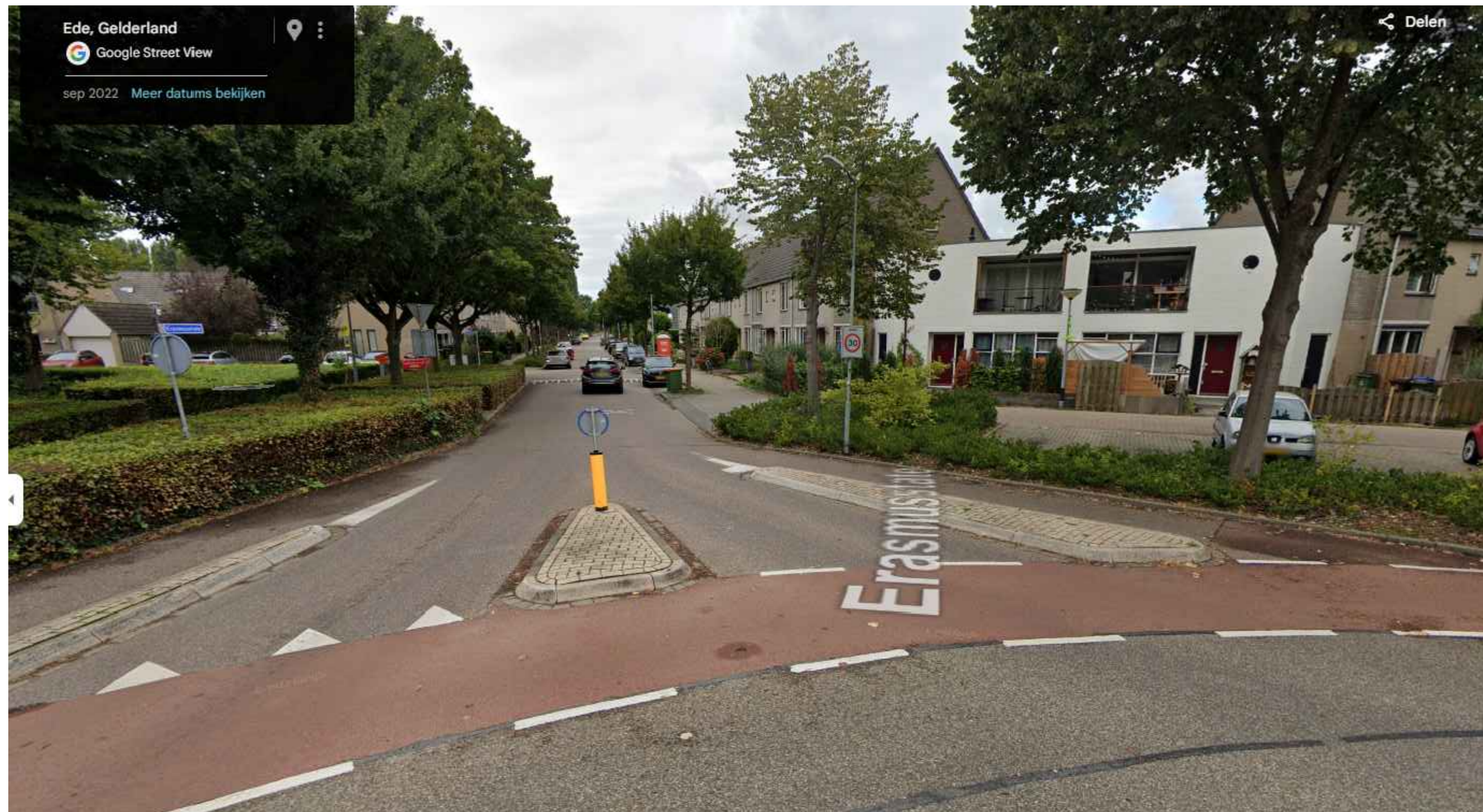
Bestaande situatie, locatie maatregel