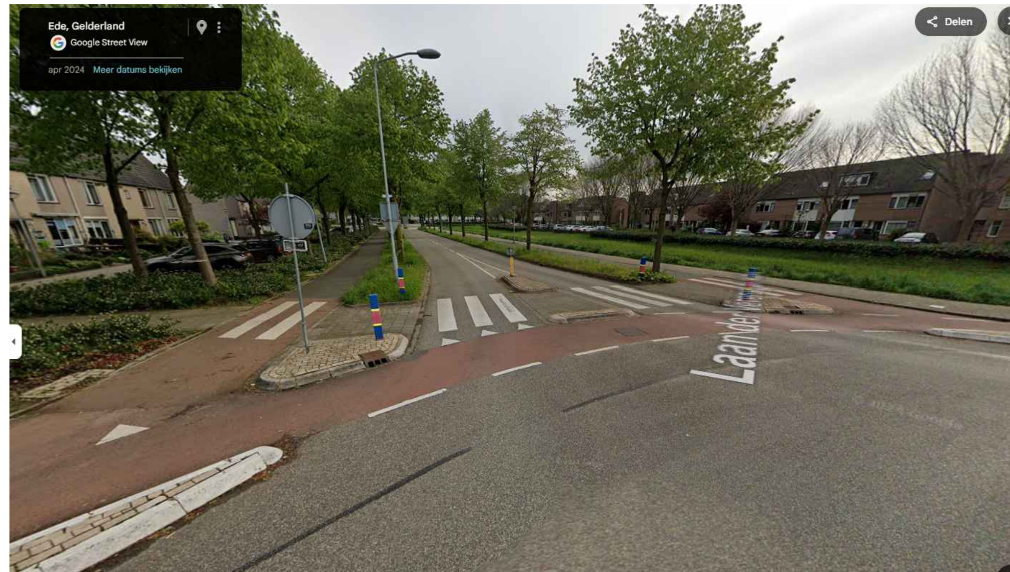
Bestaande situatie, uitgangspositie voor maatregel