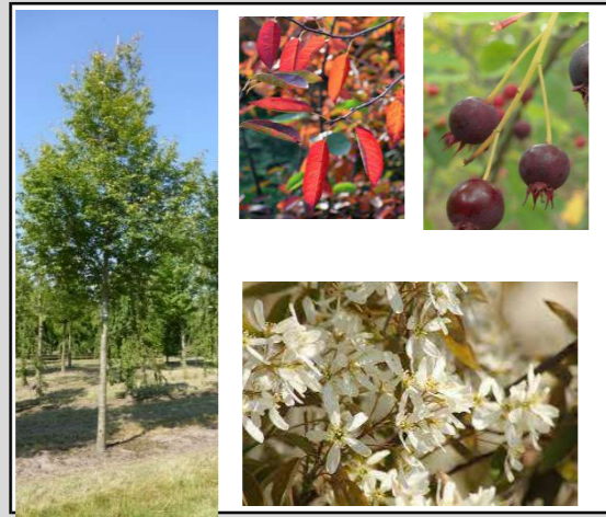
Amelanchier arborea 'Robin Hill' // Krentenboompje

Boomsoorten kunnen goed tegen droge zomers