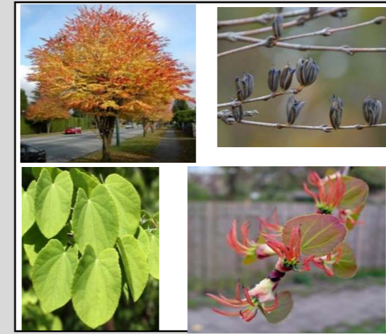
Cercidiphyllum japonicum // Katsuraboom