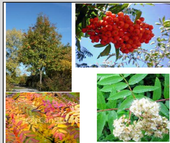
Sorbus aucuparia var. 'Edulis' // Gewone lijsterbes

Boomsoorten kunnen goed tegen droge zomers