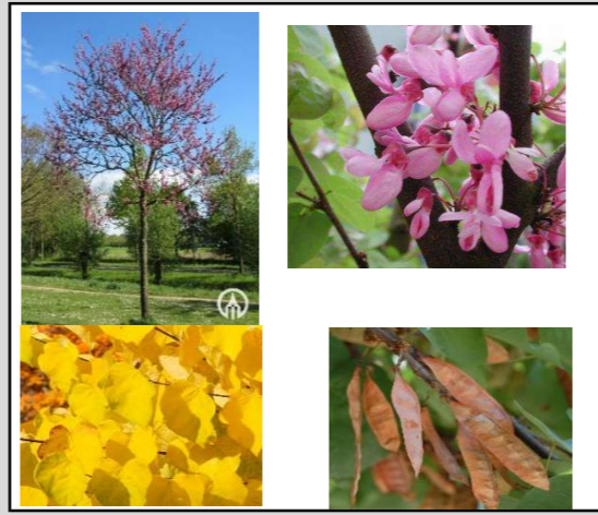
Cercis siliquastrum // Judasboom