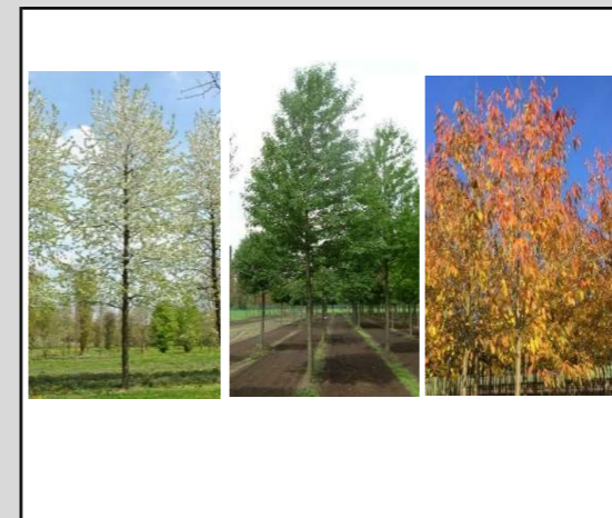
Prunus avium 'Plena' // Zoete sierkers