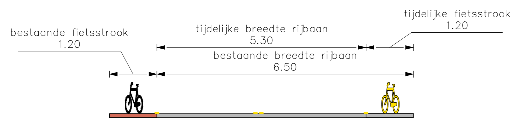
Profiel A-A Schaal: 100

Tijdelijke doorsteek parkeerterrein 't Smulhuis