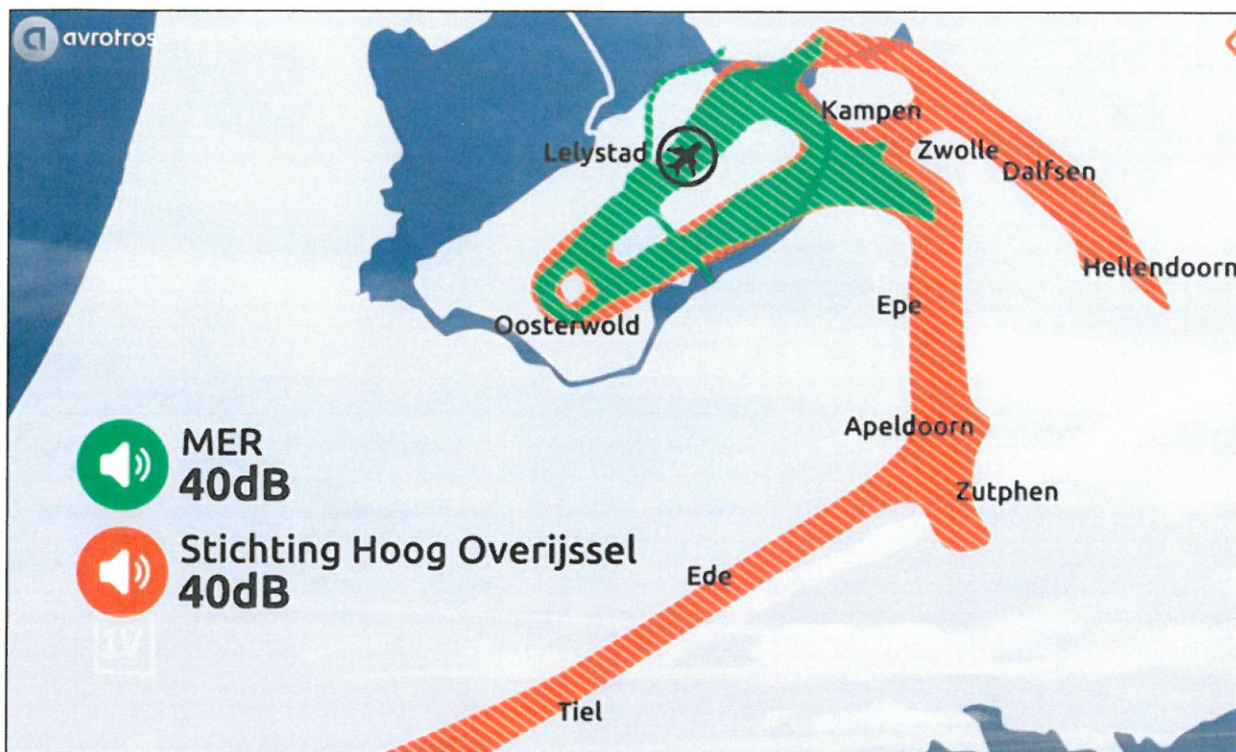
Figuur 1: Geluidscontouren vliegroutes